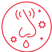
CONGESTIÓN NASAL O RINORREA O NARIZ QUE MOQUEA