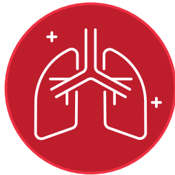
FALTA DE AIRE O DIFICULTAD PARA RESPIRAR