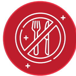
PERDIDA DE SENTIDO DEL GUSTO O EL OLFATO