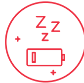
CANSANCIO O FATIGA