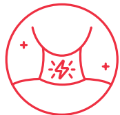
DOLOR DE GARGANTA