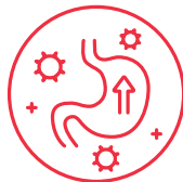
NAUSEA O VÓMITOS