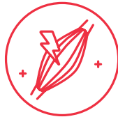
DOLOR DE CUERPO O DOLOR MUSCULAR